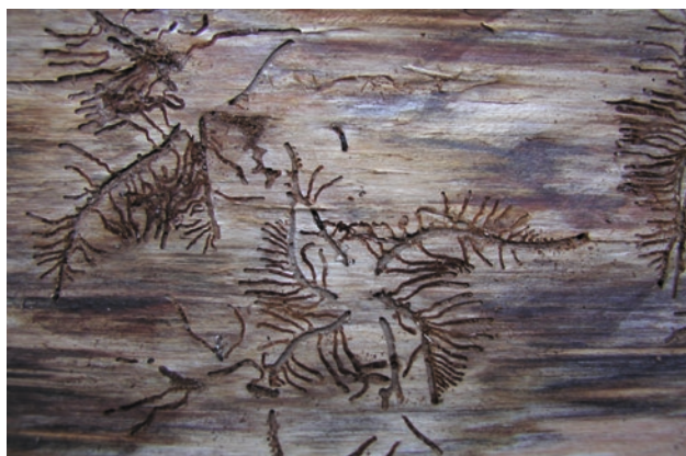
Požerek lýkožrouta lesklého