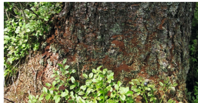
Drtinky na patě stojícího stromu

Na stojících stromech je prvním symptomem přítomnost drtinek na patě kmene. Na kmenech se objevují závrtky, doprovázené často výrony pryskyřice (pozor: v případě oslabení suchem k tomuto smolení často nedochází). Posléze dochází k barevným změnám jehličí, které postupně rezne a opadá. Dochází také k opadávání kůry, napřed na malých ploškách, později prakticky na celém kmene. Napadené stromy již nelze zachránit, je nutné je urychleně pokácet a následně asanovat. Na ležících stromech se nacházejí závrtkové otvory, vedle kterých se objevují hromádky rezavých drtinek.