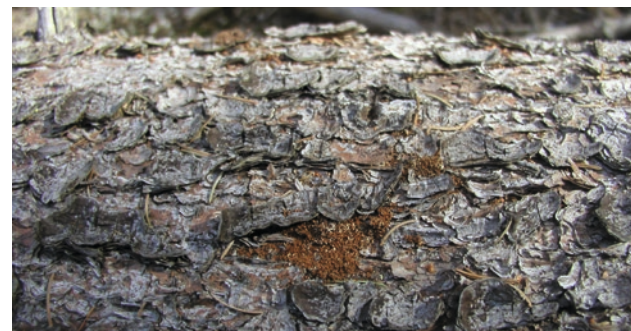
Drtinky na ležícím kmene