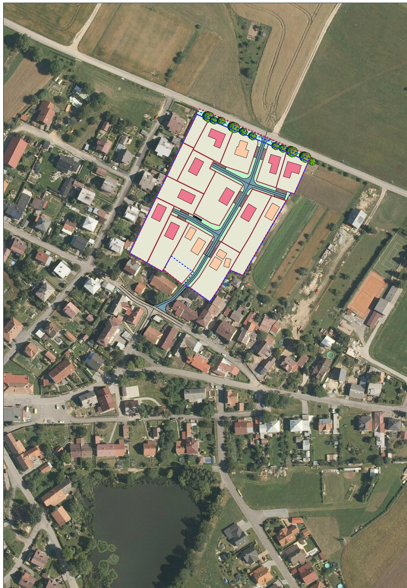
VYZNAČENÍ DO ORTOFOTOMAPY M 1:2000