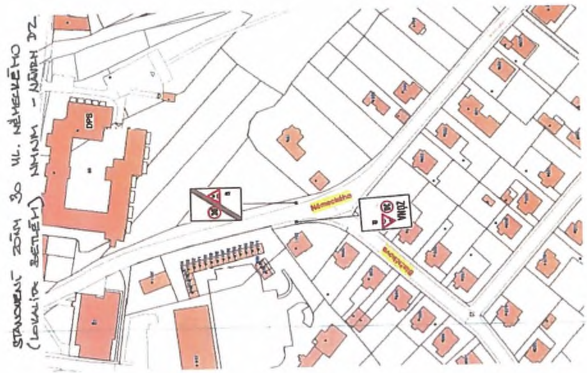
NÁVRH XPM PRVKŮ - NĚMECKÉHO NMAJ - LOKALITA ŽETĚM