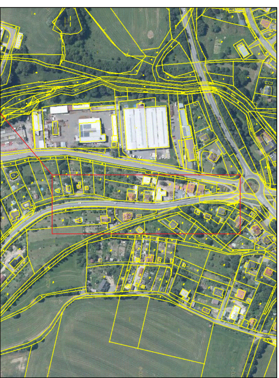
ŘEŠENÉ ÚZEMÍ – mapa KN