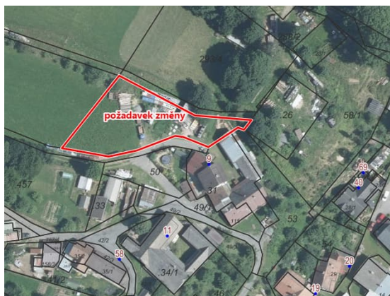
Obr.4: Požadavek žadatele na změnu.

Zařadit parcelu 354/1 v k.ú. Krásné nad Svratkou do plochy s rozdílným způsobem využití smíšené obytné venkovské. V budoucnu bych chtěla realizovat rodinný dům se zahradou popř. zahradní domek, možná bazén, včelín.