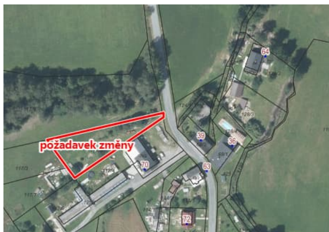
Obr.2: Požadavek žadatele na změnu.

Požaduji parcelu č. 117/8 v k.ú. Krásné nad Svratkou zařadit do zastavitelné plochy umožňující výstavbu RD a využití pozemku jako zahrady.