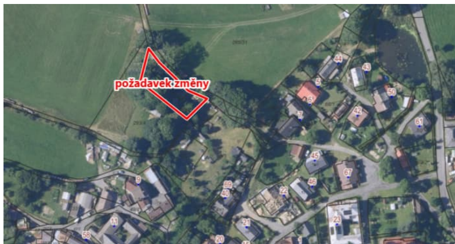
Obr.2: Požadavek žadatele na změnu.