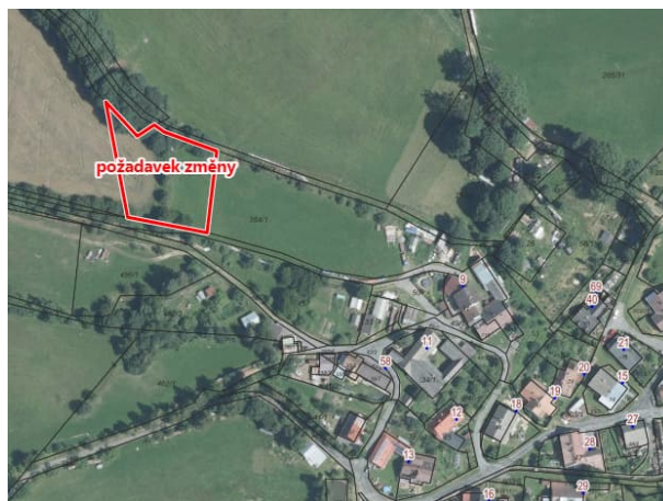
Obr.3: Požadavek žadatele na změnu.

Zařadit do zahrady. Výsadba ovocných stromů, bobulovin popř. stavba pro uskladnění náradí, včelín z důvodu samozásobitele a dobré podmínky pro stromy.