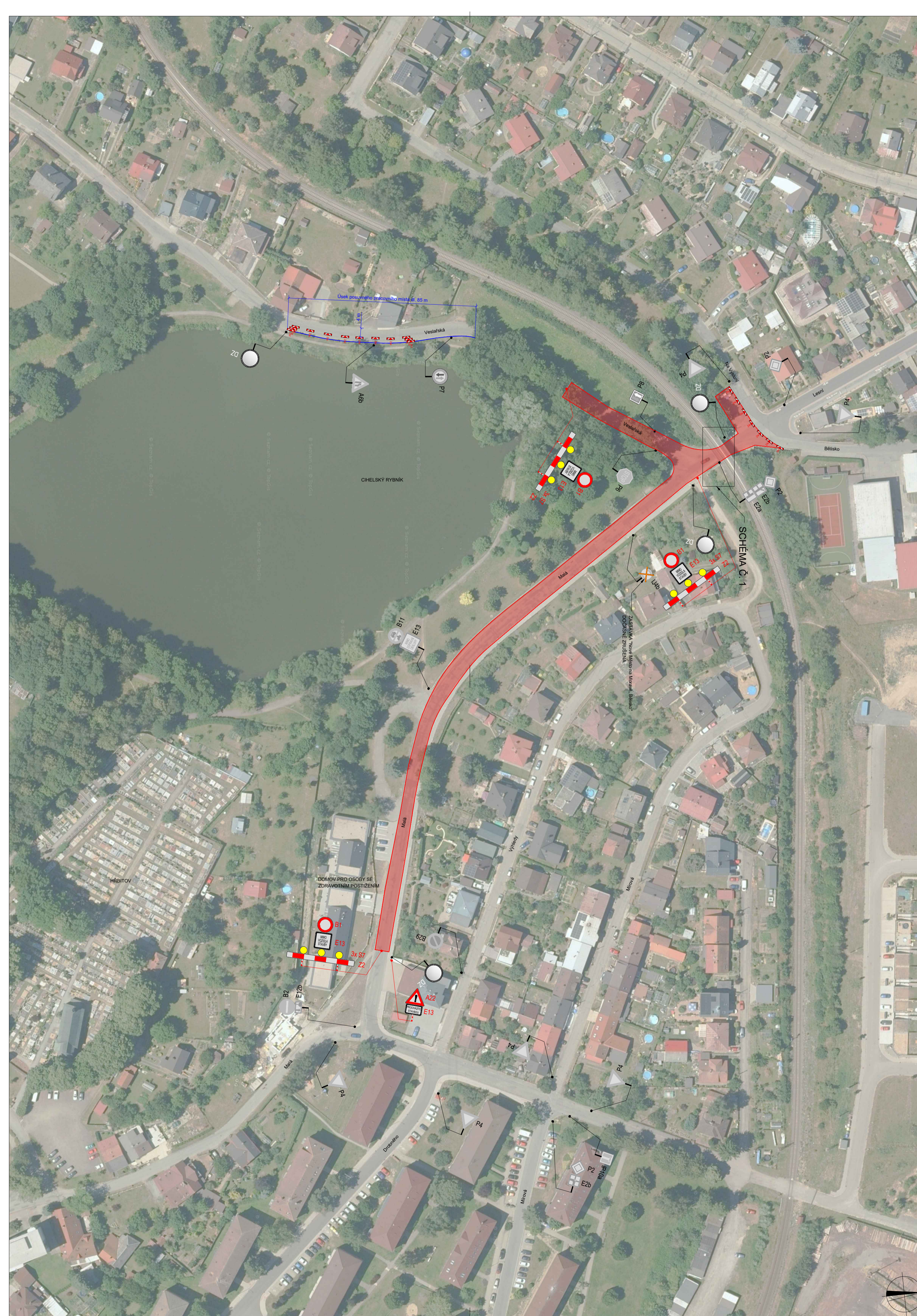
SCHÉMA Č. 1 KORIDOR PRO PĚŠÍ VEDEN STŘÍDAVĚ PO OBOU STRANÁCH VIADUKTU